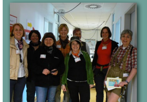
Die Frauschaft von SCHLAU